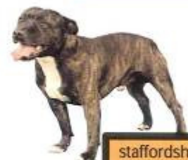
staffordshire bull terrier