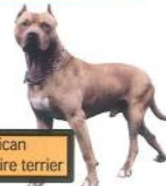
american staffordshire terrier