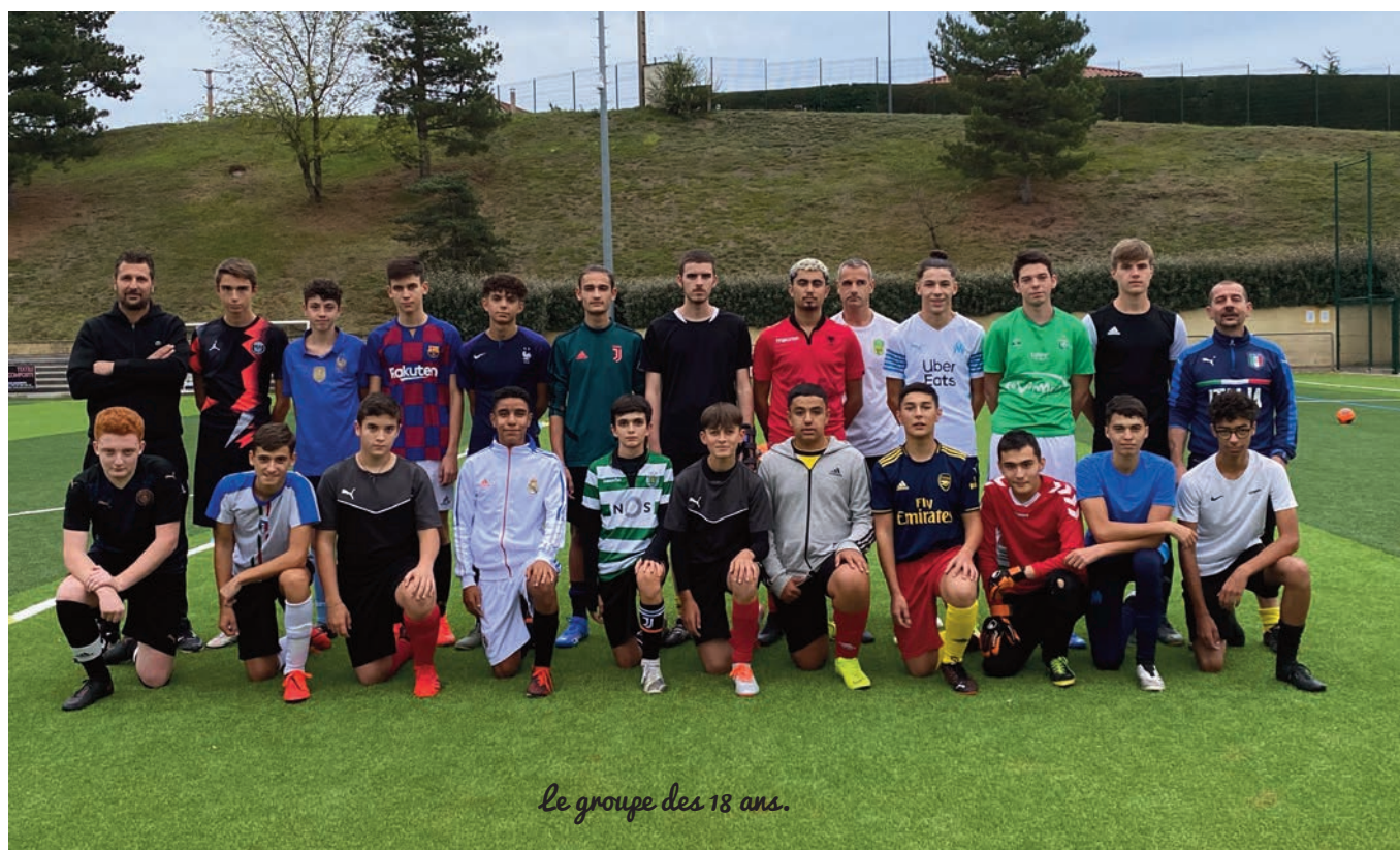
Le groupe des 18 ans.