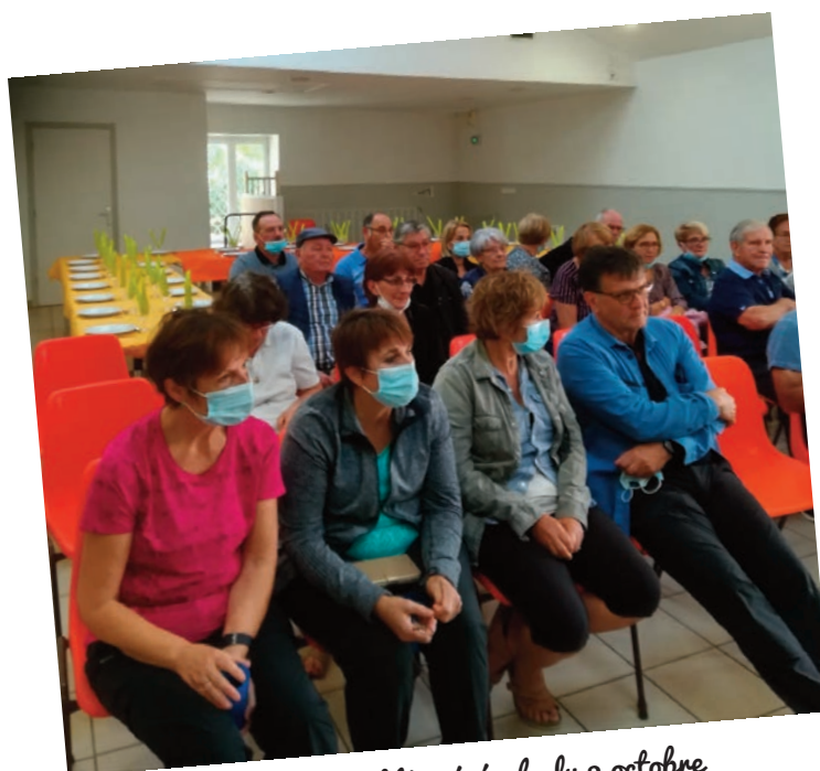
Assemblée générale du 2 octobre Une halte à Pont de Beauvoisin, au musée de la Machine

Le séjour qui devait avoir lieu l'an dernier en juin a pu se concrétiser les 10, 11, et 12 septembre à La Féclaz, en Savoie.